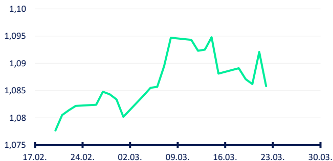
Vývoj za uplynulý měsíc